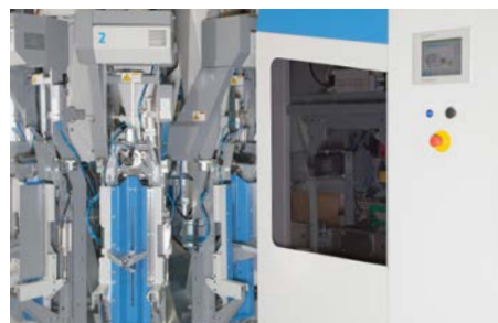
Vollautomatischer Hochleistungs-Sackaufstecker für erhöhte Verfügbarkeit