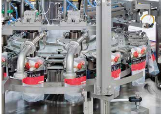
Duplex-Abfüllung von frischen Soßen

Frische Soßen oder Suppen können kalt oder heiß verarbeitet und hygienisch in Standbodenbeutel mit oder ohne Spout eingefüllt werden. Eine Formatumstellung ist jederzeit durch den Einsatz von Wechselgruppen und Zentralverstellungen sehr einfach möglich.