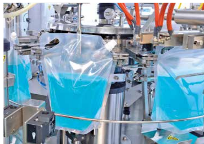
Abfüllung von Scheibenreiniger in Standbodenbeutel mit Cornerspout