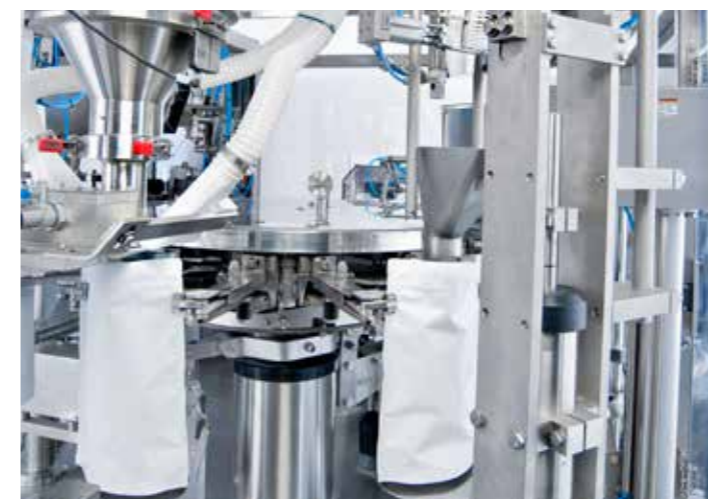
Beutelbefüllung mit Pulver und Dosierlöffel